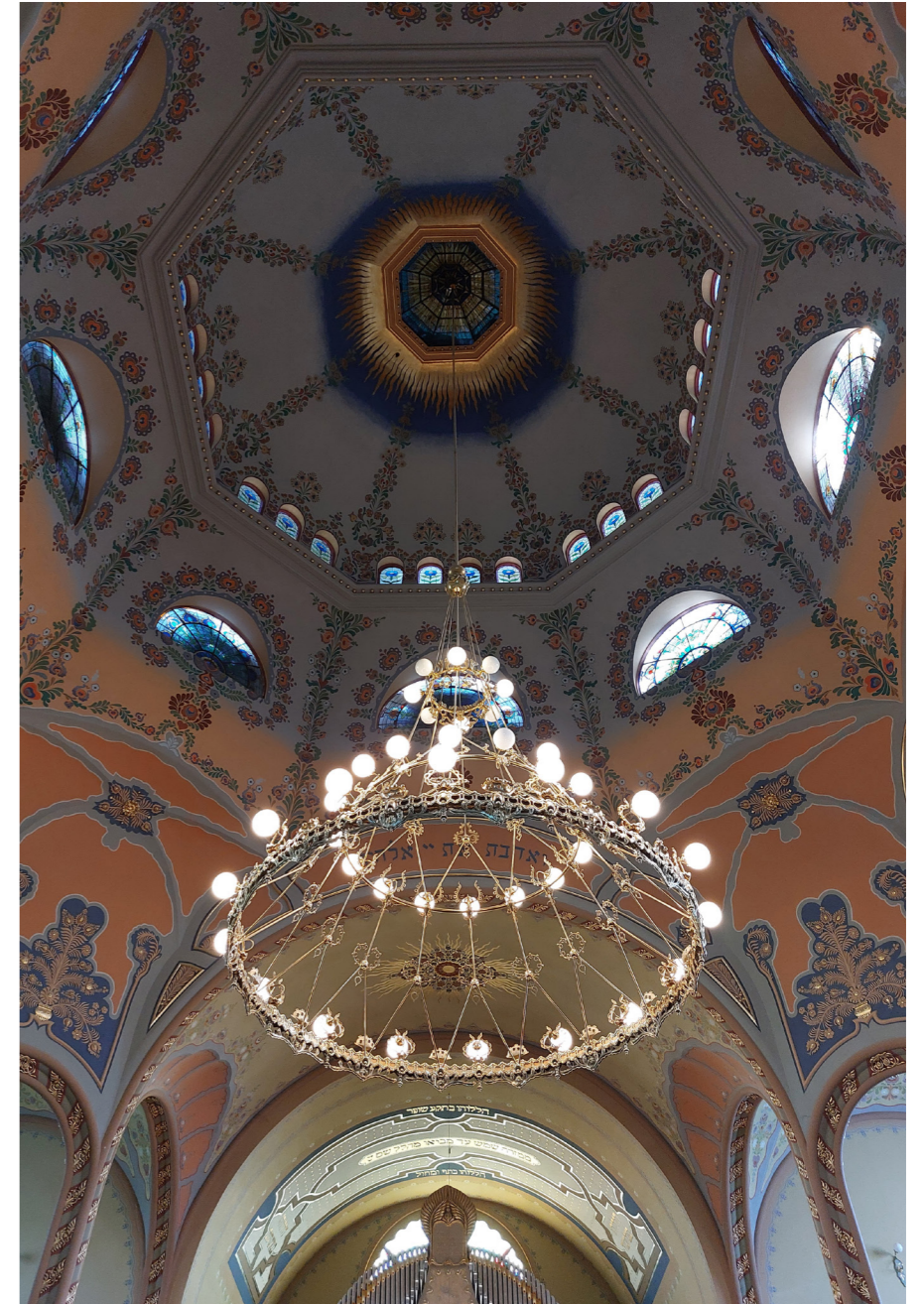
Szabadka, Zsinagóga 1903 Jakab Dezső & Komor Marcell Fotó: Jahoda Róbert 2024

Összességében tehát az ilyen építészetben az épülettömeg nem csak funkcionális szerepet tölt be, hanem esztétikai és szimbolikus jelentéssel is bír, ahol a formák eredete lehet egy díszítőminta vagy természet által ihletett alakzat.