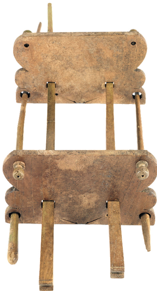
5. kép: Olvasókeret Fitzwilliam Museum, Cambridge (Inv. GR.25a-k.1980)

társaságában: fésűk, tükrök, pyxisek mellett két írotábla, tolltartó, dobozok, egy elefántcsont nyelű kés, és két lap került elő, utóbbi olyan volt, mint a Pompeiiben talált, kivéve, hogy nem volt rajta díszítés (5. kép). 28 A 12 x 8 x 0,6 cm-es lapokon kerek és négyszögletes lyukak voltak (mindegyik oldalon 6 darab), amelybe részint „dugókat”, részint pálcikákat dugtak bele. A kutatók ezt olyan könyvolvasó állványként azonosították, amely lehetővé tette, hogy a kigöngyölt tekercset belefűzzék, ezáltal megkönnyítsék annak olvasását. Ha az eszközt az asztra helyezték, az olvasónak mindkét keze felszabadult, ami lehetővé tette például a másolás munkáját (6. kép). A Pompeiiben talált két lap eredetéről nincs közelebbi információ, de nem lehetetlen, hogy köze van az I.ii.24. jelű házhoz, amelyet „Officina libraria di Acilius Cedrus” néven tartanak számon. 29 Ezekbe a könyvolvasó-keretekbe maximum 30 cm magas papirusztekercset tudtak befűzni, és az írott columna szélessége – erre a táblácskák méretéből lehet következtetni – maximum 12–13 cm lehetett. Az Egyiptomban előkerült papiruszokon a legszélesebb írott columna 9 cm. 30 Wood legalább kilenc hasonló eszközt regisztrált a Római Birodalom egykori területéről: Ostiából, Etruriából, Galliából (Nîmes, St. Gilles) és Daciából. 31