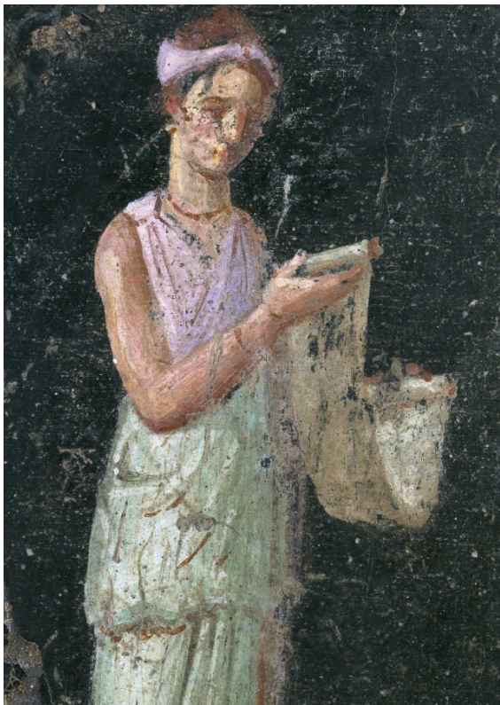
1. kép: Nyitott tekercs umbilicusszal egy pompeii falfestményen, VIII.2.39, Casa di Giuseppe II Museo Archeologico Nazionale di Napoli

körében, amiket csak Róma irányít” ( non iam quod orbe cantor et legor toto, / nec umbilicis quod decorus et cedro / spargor per omnes Roma quas tenet gentes ), hanem azért, mert birtokot és saját hintót vásárolt a versei jogdíjaiból. 8 A „díszes tekercs”-nek fordított kifejezés pars pro toto értelemben arra a pálcára vonatkozik, amelyre a papirusztekercset rátekerték, s amelyet a de luxe kiadások számára festettek, sokféle módon – például képekkel – díszítettek, vagy a leggazdagabbak akár aranyból is készíthették. 9 Ezt a pálcát „köldöknek” (görögül ὀμφαλός, latinul umbilicus ), vagy „szarvagnak” (görögül κέρατα, latinul cornua ) nevezték. 10 Leggyakrabban fából vagy csontból készítették ( in fine libri umbilici ex ligno aut osse solent poni , Porph. ad Hor. Epod. XIV. 8). Ugyanakkor már 1907-ben Theodor Birt felhívta a figyelmet egy ellentmondásra: miközben a korai principátus költői sokszor hivatkoznak a könyvtekercsek egyik legfontosabb díszének számító umbilicusra , sem a herculaneumi, sem az egyiptomi papiruszok között nem találtak ilyeneket tömegesen, 11 sőt Catullus előtt még a római szerzők sem említik, noha például Cicero sokat foglalkozott könyvkiadási kérdésekkel. Pedig Horatius is egyenesen úgy fogalmaz: iambos ad umbilicum adducere ( Epod. XIV. 8), vagyis – mai kifejezéssel élve – „a könyv utolsó lapjáig végigvinni a verset”. Az idősebb Seneca ( Suas. VI. 27) pedig a librum ad umbilicum revolvere ,