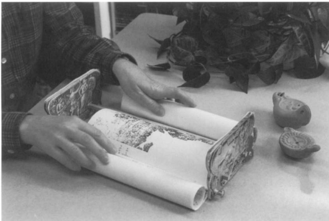
6. kép: A pompeii olvasókeret rekonstrukciója