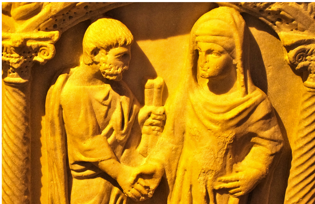
2. kép: Bal kézben tartott kétkolumnás zárt tekercs umbilicusszal egy arelatei szarkofágon „Sarcophage des Dioscures”, Musée de l’Arles antique, Arles (FAN. 92. oo. 2482)

Bár a campaniai városokban fennmaradt falfestményeken – mint az közismert – rengeteg könyvtekercs és egyéb íróanyag-ábrázolás található, a papirusztekercsek szinte kizárólag umbilicus nélkül szerepelnek rajtuk (egy ritka kivétel: 1 kép). 12 A római sírdomborműveken is elenyészően kevéssel találkozunk (2. kép).