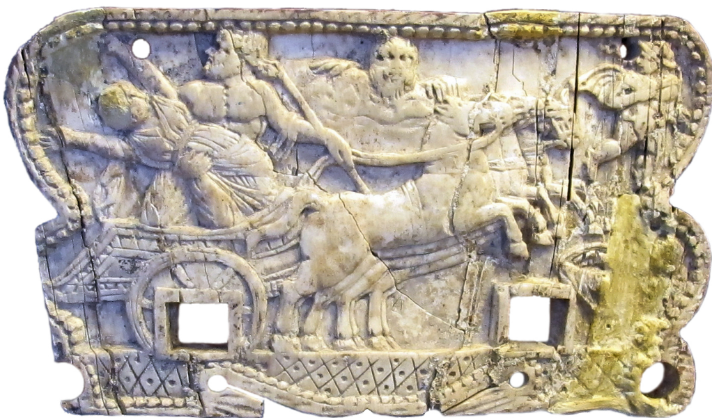
7. kép: A pompeii olvasókeret egyik elefántcsont lapja Museo Archeologico Nazionale di Napoli, 109903 B