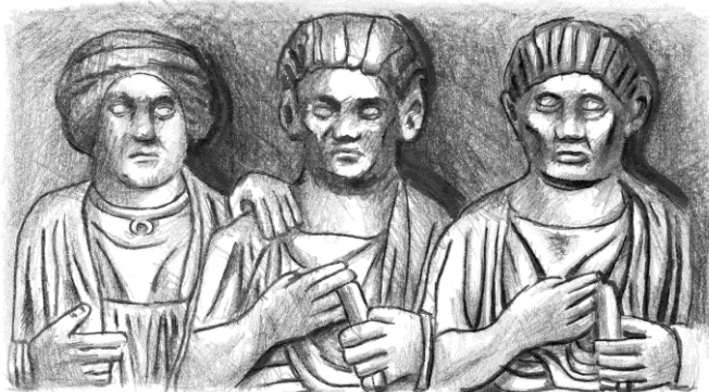
2. kép: Dombormű Pongrazenből, a férfiak bal kezében egykolumnás rotulus Pongrazen – magántulajdon, (rajz: Agócs N.)

A tekercsek eddigi értelmezései széles skálán mozognak. Henri-Irénée Marrou 1938-ban megjelent, de máig klasszikusnak számító művében ( Mousikos aner: Étude sur les scènes de la vie intellectuelle figurant sur les monuments funéraires romains ) a görög műveltségideál, a paideia kontextusában értelmezte a tekercsábrázolásokat: „A tekercsek a szellemi dolgokhoz kapcsolódnak”. 20 Jean-Michel Carrié szerint „a tekercs a par excellence kulturális tárgy, az oktatás fő közvetítője a codex megjelenéséig”, 21 és a katonák kezébe