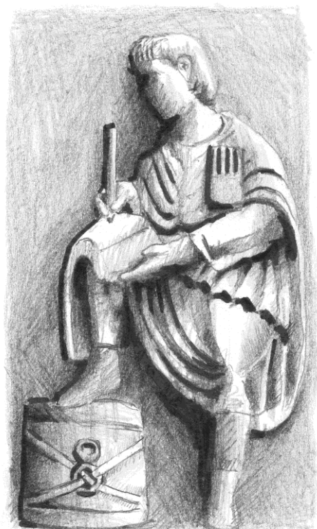
3. kép: Tekercsre író librariust ábrázoló dombormű Virunumból, Maria Saal – Propstei- und Wallfahrtskirche Mariae Himmelfahrt, (forrás: Lupa 964, fotó: Ortolf Harl, rajz: Agócs N.)