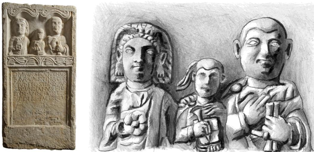
1. kép: Sírkő Celeiából, a fiú kezében stylus és polyptychon , az apa kezében kétkolumnás zárt tekercs, Celje - Pokrajinski Muzej (Inv. Nr: L 82), (rajz: Agócs N.)

sírdomborművön, amelyen egy fiatal fiú kezében stylus és polyptychon látható, a gyermek iskoláztatására utalnak a kézben tartott tárgyak (1. kép). 17