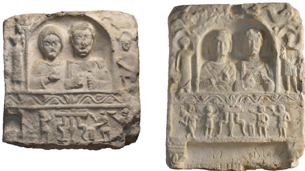
4. kép: Librarius -ábrázolások Črnomeljből (forrás: Lupa 3791, 3792, fotó: Ortolf Harl)

„áldozati jelenet” / „pannonische Totenopfer” / „pannonische Totenmahl”) 52 a férfi szolgák kezében is minden esetben áldozati eszközök ( mappa , patera , urceus ) találhatóak egyetlen esetben sincsenek náluk íróeszközök. 53 Ráadásul, a noricum librarius -domborművekkel ellátott síremlékeken nem látunk halotti lakomákat. Jóllehet Pannonia Superior déli részéről, a szlovéniai Črnomeljből ismerünk két olyan sírsztélét ( Lupa 3791, 3792), 54 amelyek fő képmezőjében nő és férfi portréja látható, a férfi baljában irattekercs, jobbjá Zweifingergestust formál. A portréktól balra szolgálólány tükörrel, jobbra librarius -szolga nyitott tekerccsel. A fő képmező alatt – elkülönítve – tripus -jelenet, a librarius tehát nem e jelenettel összefüggésben értelmezendő (4. kép).