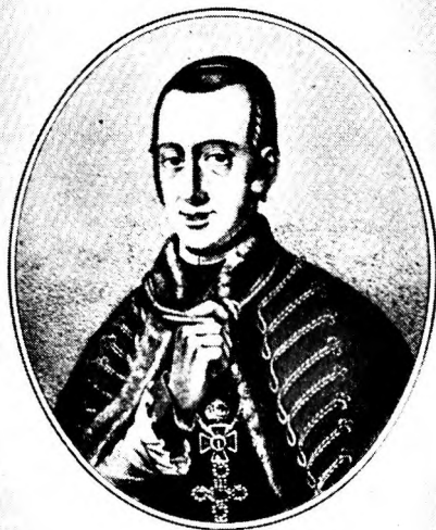
NÉGYESI BÁRÓ SZEPESY IGNÁC PÉCSI PÜSPÖK

Az általa emeltetett létesítményeken kívül 1991 óta utcanév is őrzi emlékét. Szobra a Dóm előtti téren áll.