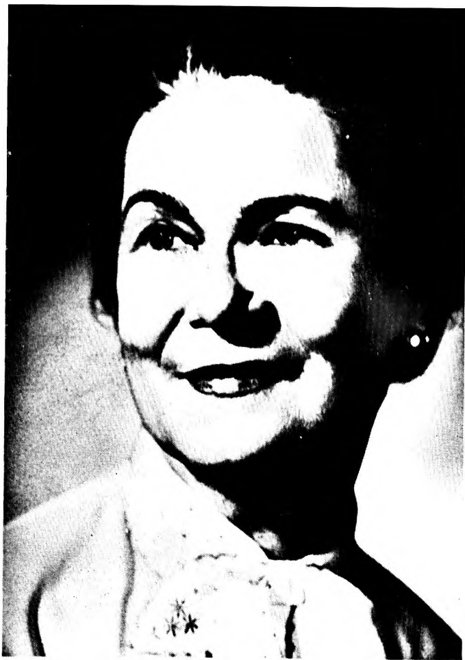
A Kazinczy-díj alapítója