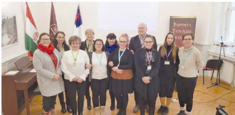
A szekszárdi résztvevők

A szociális biztonság megteremtését és megőrzését célként megfogalmazó szociális törvény megalkotásának 30. évfordulóra emlékeztek a Pécsi Tudományegyetem Kultúratudományi, Pedagógusképző és Vidékfejlesztési Kar, a Baptista Teológiai Akadémia (a Baptista Egyházi Szociális Módszertani Központ támogatásával), valamint a Semmelweis Egyetem Szociális Vezetőképző Tudásközpont által 2023. december 8-án Budapesten szervezett tudományos konferencián.