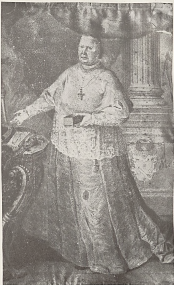
Klimó György pécsi püspök. (1710—1777).