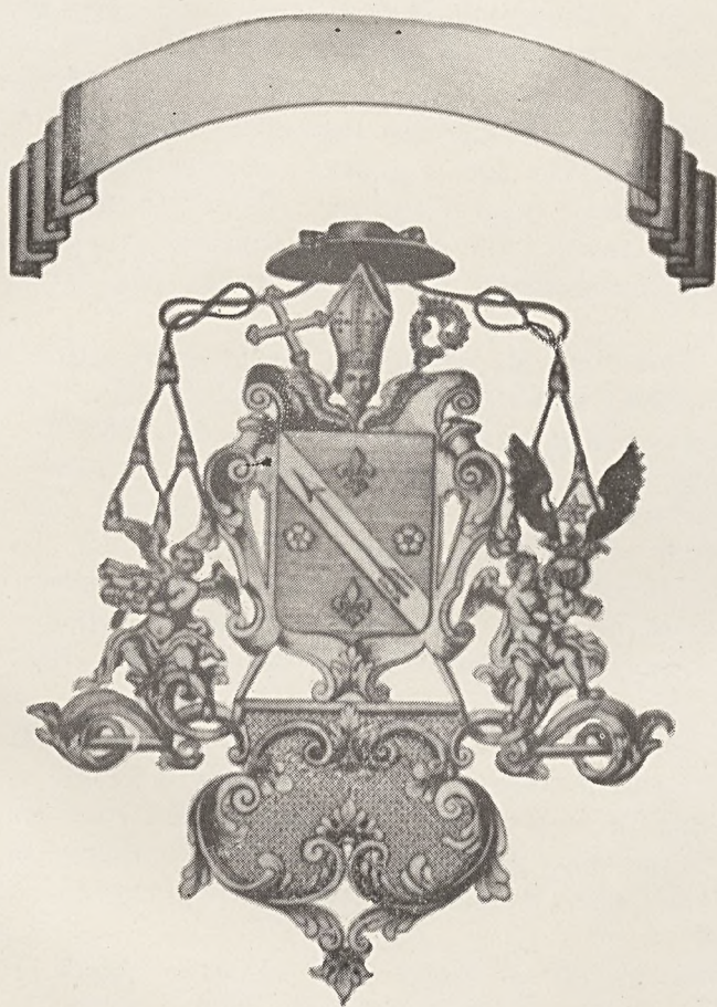
Klimó György pécsi püspök exlibrise.