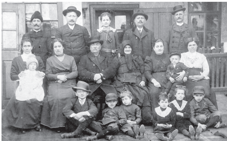
2. kép: Archaikus paraszti nagycsalád (Kecskemét, 1912) 30