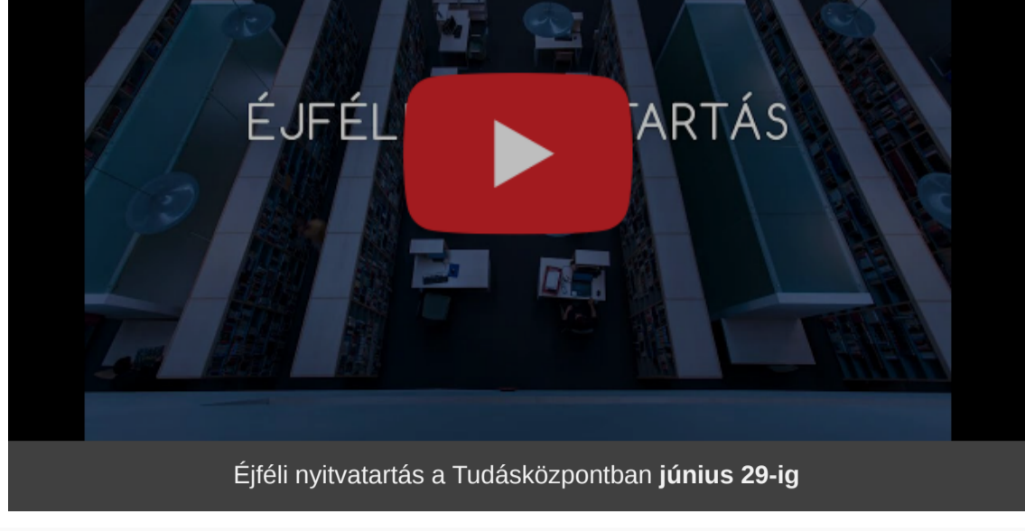
Éjfél nyitvatartás a Tudásközpontban június 29-ig

A kari egységek nyári nyitvatartásáról itt tájékozódhat. Minden kedves olvasónknak kellemes pihenést kívánunk! More info on the opening hours of the faculty libraries. We wish our readers a great summer!