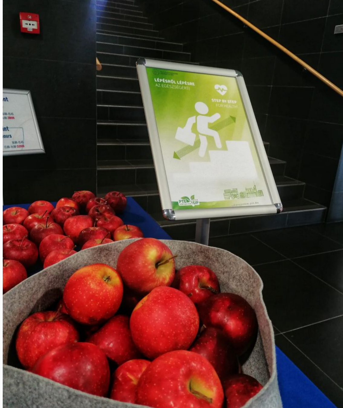
Zöld lépések az egészségért Köszönjük, hogy elfogadtátok a kihívást és lifthasználat helyett velünk lépcsőztetek. A lift mellőzésével közös zöld lépéssel ti is hozzájárultok a Pécsi Tudományegyetem fenntartható ökológiai céljainak megvalósításához. Minden zöld lépés számít!