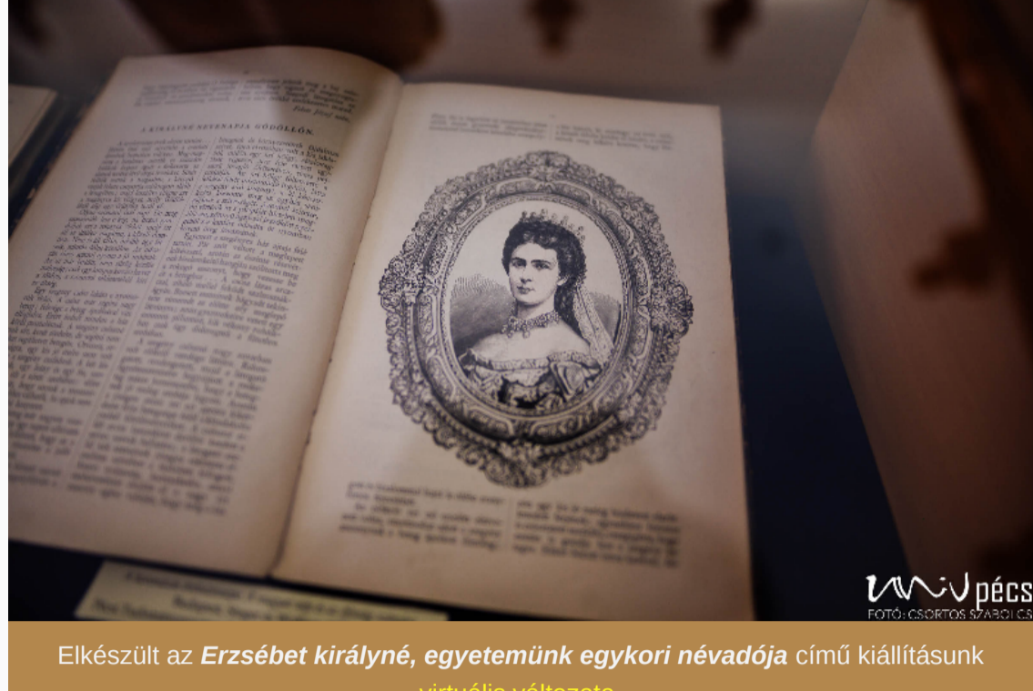
Elkészült az Erzsébet királyné, egyetemünk egykori névadója című kiállításunk virtuális változata .