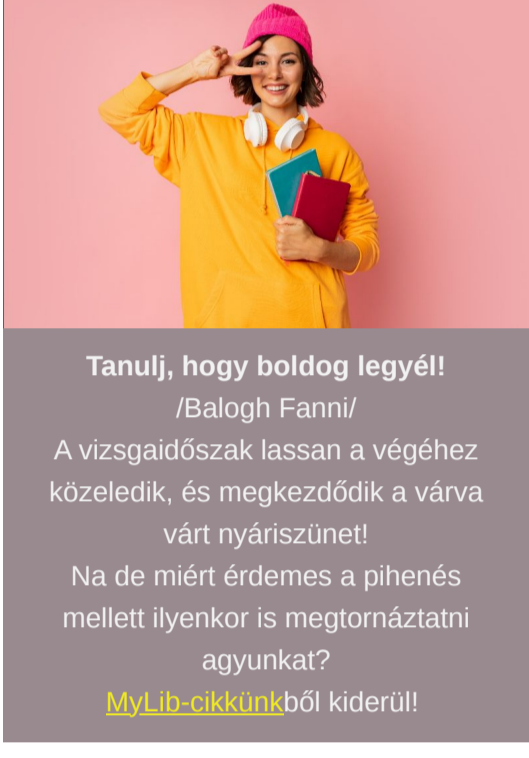
Tanulj, hogy boldog legyél! /Balogh Fanni/ A vizsgaidőszak lassan a végéhez közeledik, és megkezdődik a várva várt nyári szünet! Na de miért érdemes a pihenés mellett ilyenkor is megmozdítani agyunkat? MűJlc szöveg bőví kiderül!