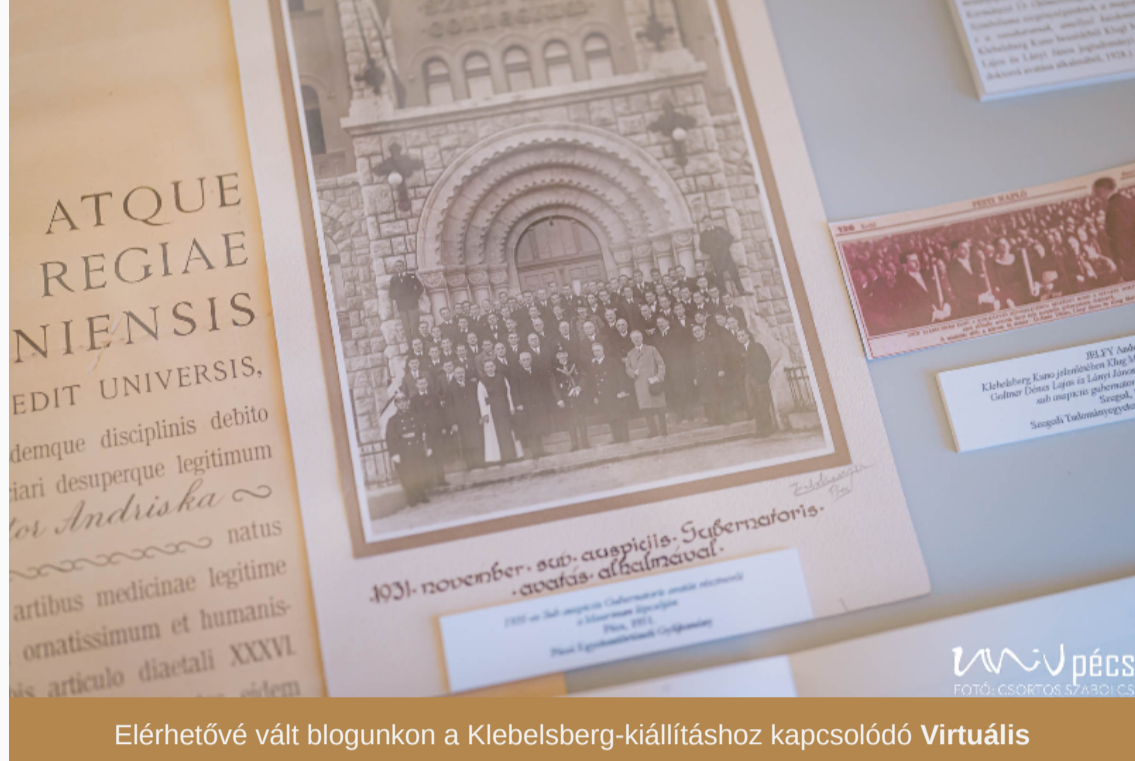
Ekrhetővé vált blogunkon a Klebelsberg-kiállításához kapcsolódó Virtuális múzeumgárgóliai foglalkozás online változata .