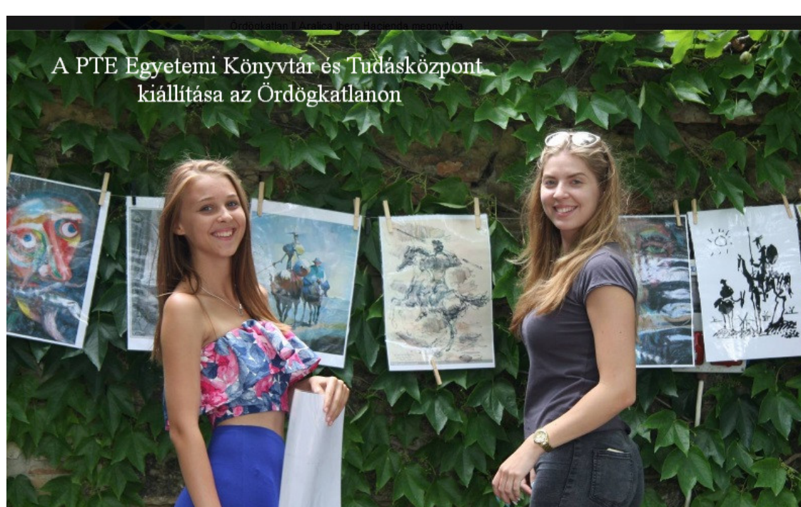
A PTE Egyetemi Könyvtár és Tudásközpont kiállítása az Ordögkatlanon