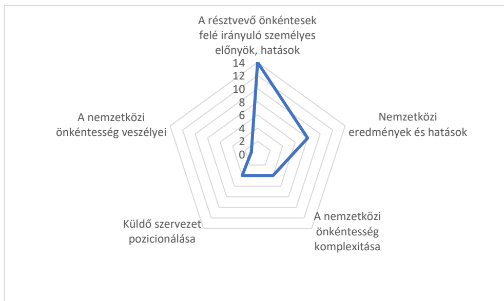
2.ábra: A nemzetközi önkéntesség diszkurzív témái (előfordulásuk száma és aránya szerint)

Részletesen elemezve a kvalitatív vizsgálatba bevont 25 cikk és televíziós tudósítás szövegét, összesen 12 különböző társadalmi szerepet azonosítottam, amelyek öt nagy diszkurzív téma köré csoportosíthatóak. Ezek – előfordulásuk arányában – a következők: a résztvevő önkéntesek felé irányuló személyes előnyök és hatások, a nemzetközi eredmények és hatások, a nemzetközi önkéntesség komplexitása, a küldő szervezetek pozicionálása, valamint a nemzetközi önkéntesség veszélyei (2.ábra).