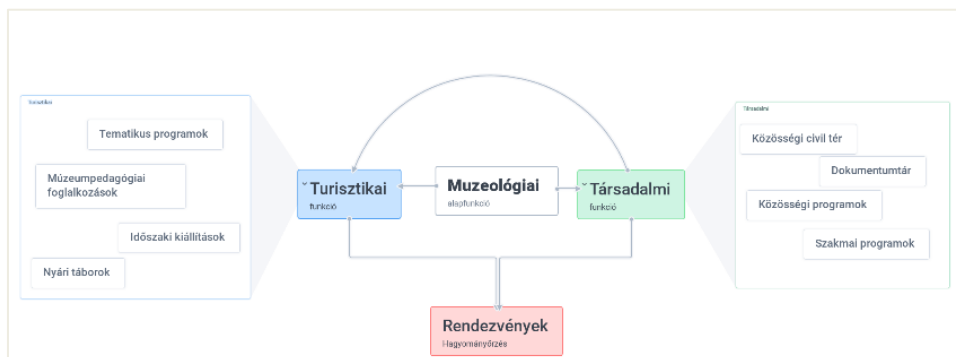
2. ábra: A német tájházak hasznosítási modellje

identitástudatának erősítésére szolgáló civil közösségi tér megszületéséhez és hasznosításához (2. ábra).