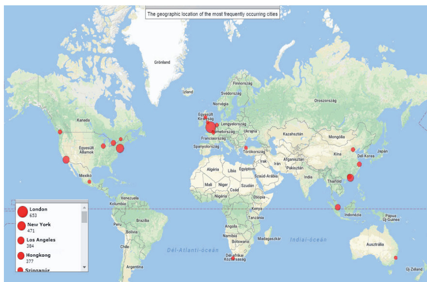
2. ábra: A kulcsszavakként legtöbbször említett városok területi elhelyezkedése Figure 2. Mapping cities on the basis of the total number of keyword occurrences

A vizsgált időszakban a legtöbbször említett latin-amerikai város Mexikóváros volt (összeségében a 16.), míg a régióból a második helyezett Sao Paulo és a harmadik helyezett Buenos Aires csak az összesített rangsor 42. és 43. helyen állt (2. ábra). Mexikóváros az említések többségében egyedül szerepel (tehát nem az Egyesült Államokhoz való földrajzi közelsége miatt emelkedik ki) és inkább a jelentős népességszámból eredő városi problémák, illetve az egyedi urbánus karaktere miatt kerül a figyelem középpontjába, és nem a világgazdaságban betöltött szerepe miatt.