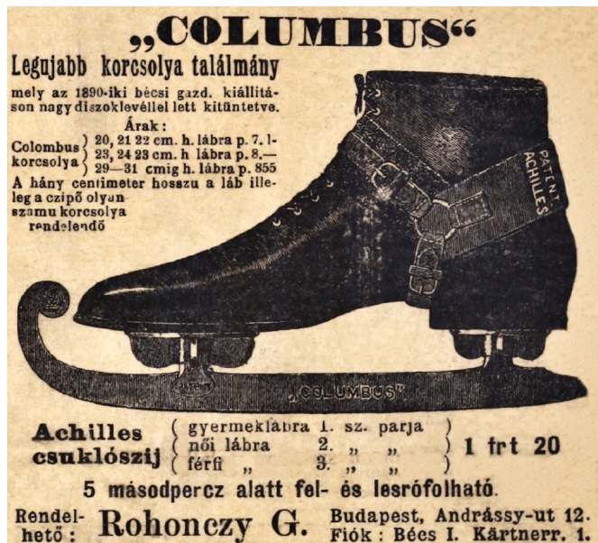
2. kép – Columbus korcsolyacipő (hirdetés)

csolya), továbbá a műjéggyártás korszerűsítése. 23 A korcsolyázás külön ruhadvatot hívott életre. A magyar újságokban a korcsolyasporttal összefüggő, 19. század végén keletkezett írások tetemes részét teszik ki azok a rajzos tudósítások, melyeket a női olvasók számára írtak a párizsi, bécsi és pesti korcsolyázóruhákról. Türelmetlen hölgyek követeltek újabb és újabb modelleket az újságoktól, melyek olvasói levelekre válaszolva vadonatúj ruhák rajzait közölték. 24 Még a századvégen is gyakran olvashatunk efféle híradásokat az újságokban, és tél elején minden évben szokás volt az, hogy a jégpálya megnyitására külön toilletet csináltattak az asszonyok. 25 A nők számára a korcsolyázás tehát több volt, mint