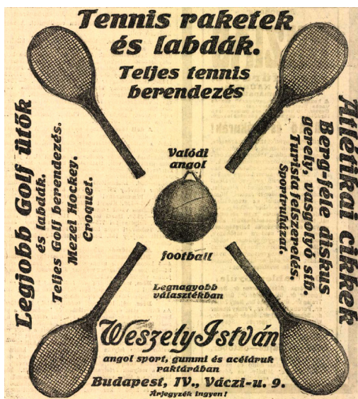
6. kép – Teniszfelszerelések (hirdetés)

A teniszezés mint új sportág Magyarországon csak lassan indult térhódító útjára, különösen a nők körében. Miközben Dublinban már 1872-ben megrendezték az első női teniszbajnokságot, Magyarországon csak 1885-ben alakult meg az első olyan teniszegylet, amelynek tagjai akár hölgyek is lehettek. Érdekesség e sportág magyar történetének kezdeti időszakából, hogy az 1894-ben rendezett balatonfüredi országos (férfi) teniszbajnokságot egy nő, Pálffy Paulina grófnő (becenevén Lincsi) nyerte meg, 56 a döntőben 5:3-ról fordítva 11:9-re Demény Károly ellen. 57 Szintén a korszakra jellemző adalék, hogy ő volt az első olyan hölgy, akit hazai bajnokként elismertek, mert sem az 1890-es nyertest, a híres arisztokrata politikus és országépítő Széchenyi István gróf unokáját, Alicét, sem pedig az 1891-es év bajnokát, Stefánia főhercegnőt nem kiáltották ki hivatalosan győztesnek, bár elismerően szóltak róluk. 58 Az első, nők számára kiírt teniszverseny 1908-as női egyesének győztese a korábban már jelentős magyar és nemzetközi bajnoki sikereket elért, a Budapesti Lawn Tennis Club színeiben induló Madarász Margit volt. A Nemzeti Sport (mely számtalanszor tudósított a legkiválóbb magyar nők sporteredményeiről is a századelőn) ugyanebben az évben arról számolt be, hogy Madarász másodszor nyerte meg a németországi női egyes versenyt, és ugyanott Cséry Katica pedig (L. Transterrel) megnyerte a vegyes-