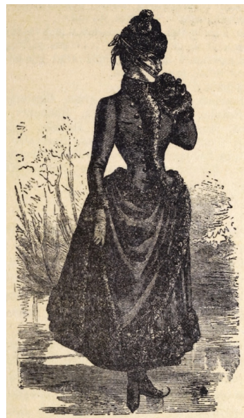
3. kép – Korcsolya-toilette

holmi sport. A fiatal lányok a jégpályán fiatalemberekkel ismerkedhettek, találkoztak a hódolóikkal, a férjes asszonyok számára pedig a jégpálya a társasági élet és a „divatbemutató” egyik színtere volt a 19. század végén.