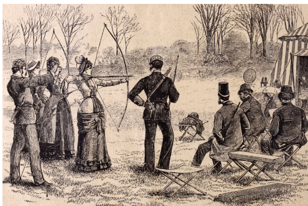
7. kép – Nyilazó társaság

A vívást gyakorló hölgyeknél is kevesebb kiváltságos nő vehetett részt a főúri vadászaton. A Vasárnapi Ujság című hetilap 1880-ban kuriózumként közölte a hírt a francia hölgyek körében akkoriban terjedő időtöltésről. 63 A lapban egy férfi még 1909-ben is gúnyolódva és lekicsinylően szólt a női vadászokról, akiknek szerinte még elnevezést sem lehet találni, olyannyira alkalmatlanok e „sport” művelésére. Szerinte a nők hiába vadásznak, mert nem értenek az effélékhez; soha nem tudnak csendben maradni; nincs bennük szenvedély; alkalmazkodásra hajlóak; csak a fess vadászuha érdekli őket; nem mennek el egyedül vadászni; azt sem bánják végeredményben, ha elmarad a vadászat. 64 A főúri körök nőtagjai azonban részt vettek a vadászaton, miként ezt például Izabella főhercegnő újságokban is gyakran közölt fotói mutatják. 65 Nyilazó hölgyekről is láthatunk olykor újságképeket. 66