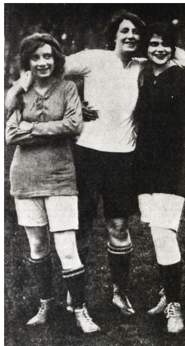
11. kép – Futballozó angol színésznők

1914-ben a Tolnai Világlapja már arról írt, hogy a nők az olyan nehéz sportágakat is űzik, mint a birkózás, futás, futballozás, ez utóbbiról írva fotóval illusztrálva jelezték, hogy Angliában már meccset is rendeztek nőknek, igaz, hogy „egyelőre csak a – mindig függetlenebb – színésznők vettek részt benne.” 103