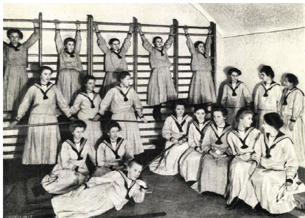
10. kép – Lányok a tornateremben

A forrásfeltárások egyértelműen mutatják, hogy a 19. század második felének magyar sajtó- és könyvkiadása növekvő számban közölt a lányok testi nevelésével és egészségvédelmével kapcsolatos írásokat. Ezek egy része a külföldi testi nevelés eredményeit, fejleményeit mutatta be. Az innovatív gondolatok mellett sok volt közöttük a lánytestnevelés elhanyagolásával, a divat szélsőséges és egészségre ártalmas kinövésével kapcsolatos kritika is. A leányiskolai testnevelés Magyarországon főként városi környezetben kezdett