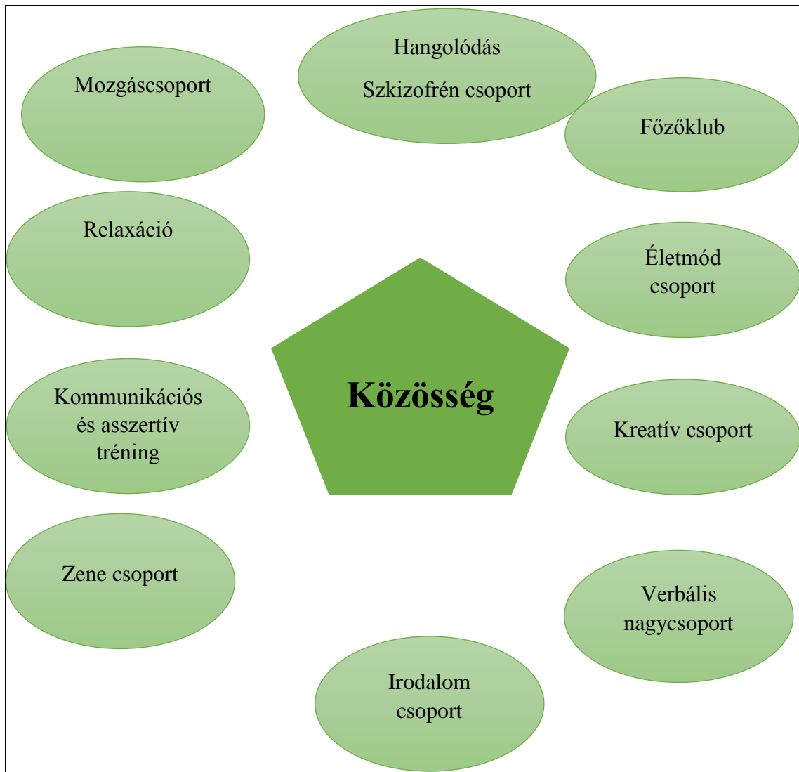
3. ábra A reintegrációt elősegítő közösségi programok

A kontroll csoport tagjai nem vettek részt pszichoszociális intervencióban, pszichiátriai gondozásban részesültek, ami azt jelenti, hogy havi legalább 1, legfeljebb 5 alkalommal vettek részt pszichiátriai gondozáson (pszichiáter szakorvossal történő személyes találkozás keretében).