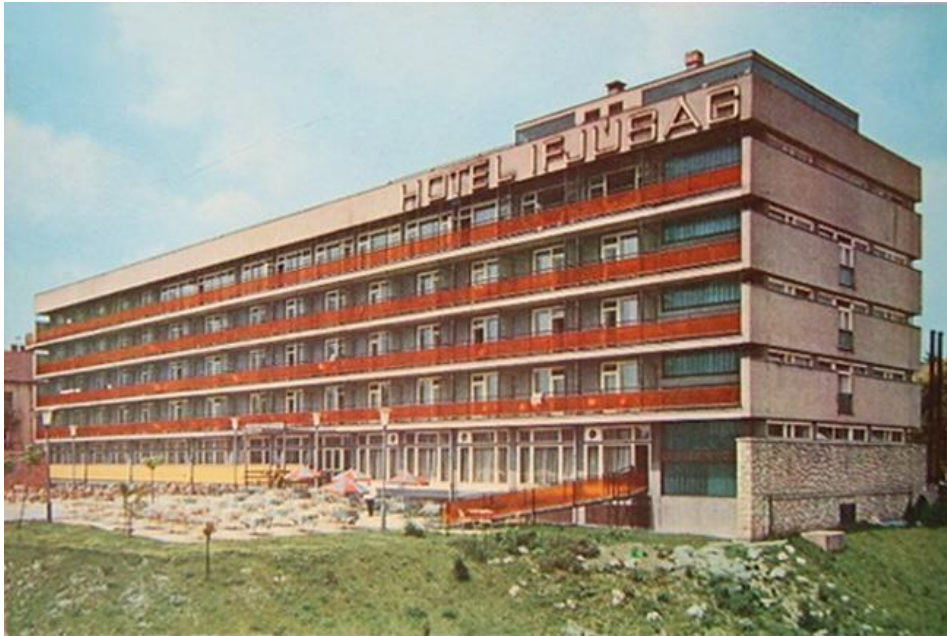
11. kép Hotel Ifjúság (Budapest)

a Hotel Ifjúság adta ennek az egyik alapját, ahova minden este felváltva jártak a rajkósok muzsikálni és szórakoztatni a közönséget. Ezek a fellépések nem csak színpadi gyakorlatot biztosítottak a gyerekeknek, de sikerélményen túl a fizetés is kiváló motiváló erő volt számukra. Ezek egyfajta tanműhely szerepét töltötték be. Úgy érezhették, hogy érdemes tanulni és gyakorolni, hiszen már a diákéveik alatt elkezdhették learatni a munkájuk gyümölcsét.