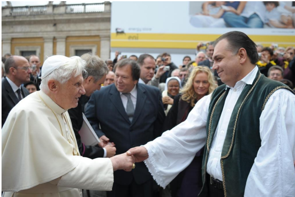
9. kép XVI. Benedek pápa és Vidák Zsigmond (prímás)

2009. november 4-én XVI. Benedek pápa és mintegy 60 ezer zarándok előtt lépett fel a Rajkó Zenekar Vincze Lilla közreműködésével a Vatikánban, mely a zenekar életében az egyik legkiemelkedőbb koncertnek számít. Ezt követően a zenekar tagjai és a vezetők közül hárman is személyes audiencia keretében találkozhatott a pápával, majd a Vatikán Rádióban élőben szerepeltek.