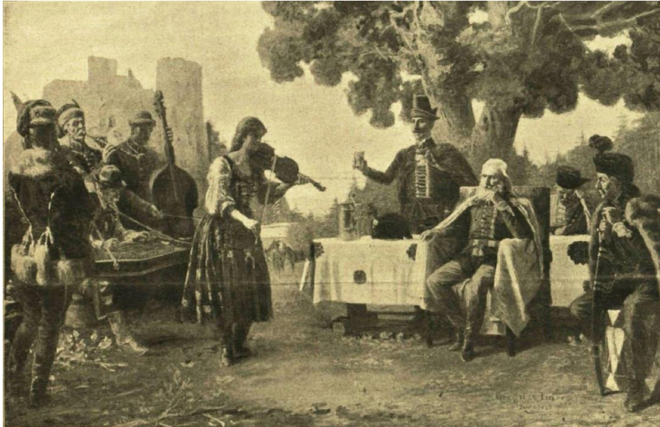
1. kép Greguss Imre: Czinka Panna, festmény