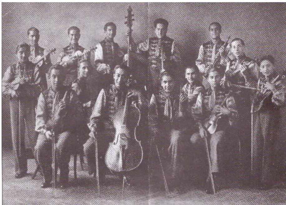
2. kép Rajkó Zenekar az 1920-as évek végén