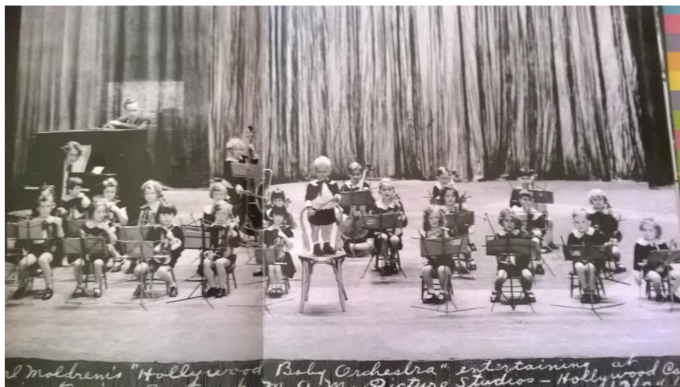
4. kép The official Hollywood Baby Orchestra (1931. dec. 24.)

1934-ben New Yorkban lépett fel a leghíresebb Baby-orchester, melyben a legidősebb muzsikus 6 éves, a legfiatalabb pedig 23 hónapos volt. A gyerekek természetesen kisméretű hangszereken, 32 cm-es hegedűn, 95 cm-es csellón és 120 cm-es nagybőgőn játszottak, melyeken elképesztően szólhattak a különböző klasszikus zeneművek. A fúvós hangszereket mellőzték a gyerekek tüdejének fejletlensége miatt. A legnehezebb természetesen a kottaolvasás betanítása volt, de ezt legyőzve már gyorsan haladtak. (A sárga "rajók"..., 1941)