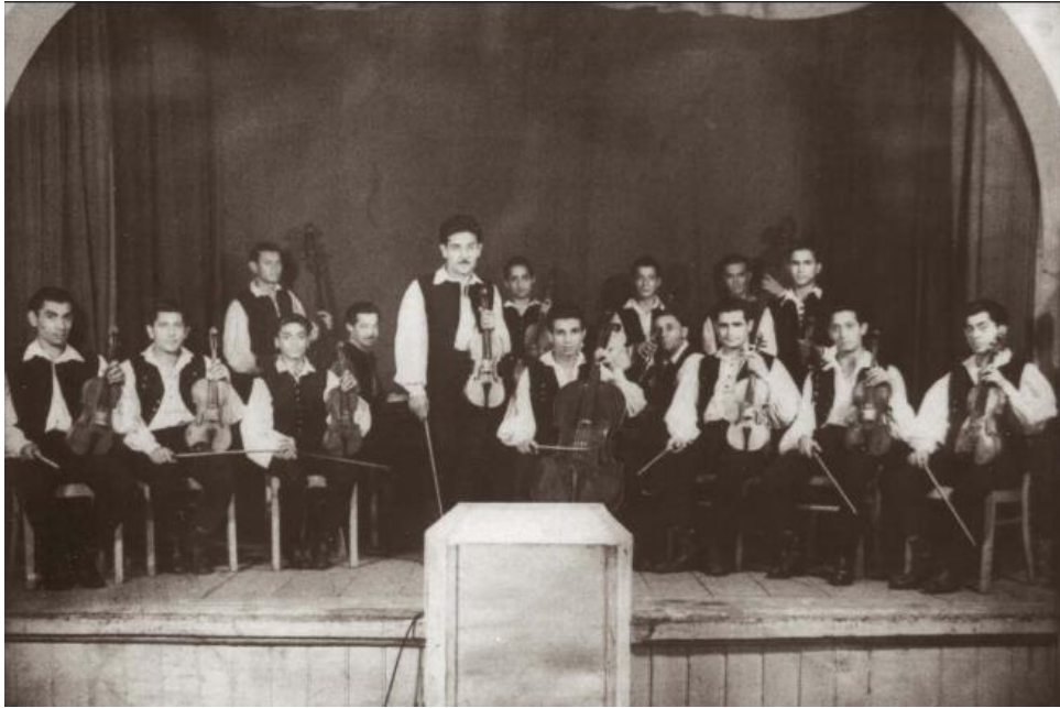
5. kép Újpesti Rajkó Zenekar (1956)

A II. Világháborút követő átmeneti évek után 1952-ben Farkas Gyula megalapította a ma ismert Rajkó Zenekart, amely sokkal nagyobb sikereket ért el, mint aminek ő maga is korábban tagja volt az 1930-as évek második felében. Így a következő rész Farkas Gyula életének és munkásságának bemutatásával foglalkozik, hogy jobban megismerjük azt a pedagógust, aki a cigányzene oktatásában a legmeghatározóbb személyiség volt a XX. század második felében.