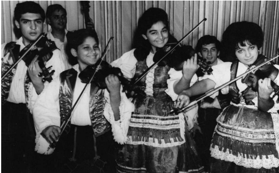
7. kép Rajkó Zenekar (1966)