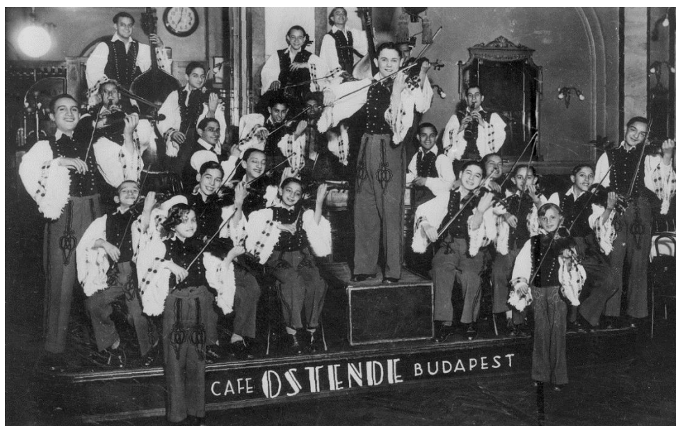
3. kép: Rajkó zenekar az 1930-as évek végén. (képeslap)

Az 1930-as évek második felében az Ostende Kávéházban működő Rajkó zenekarról számos képeslap is készült, hogy az ide látogató turisták megoszthassák emlékeiket a világ számos pontján élő ismerőseikkel.