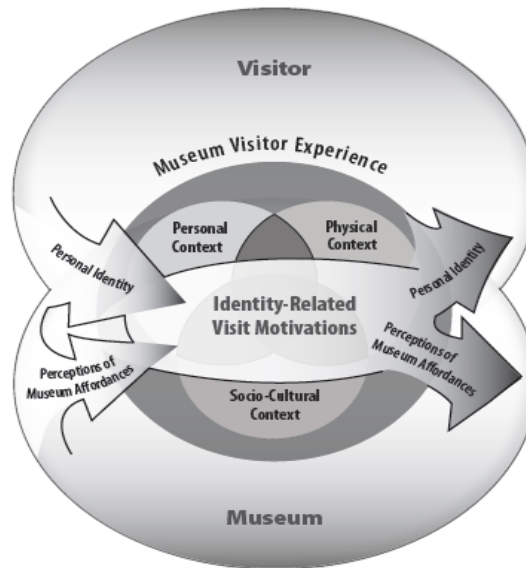
The Museum Visitor Experience and the Role of Identity-Related Visit Motivations.

különböző kommunikációs aktusok révén megváltoztatja azt.