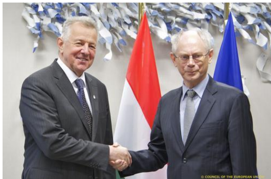
President VAN ROMPUY (right) – Hungarian President, Pál SCHMITT

A 27 uniós tagállam állam-, illetve kormányfői március 1-jén egyhangúlag Herman Van Rompuyt választották az Európai Tanács elnökévé. A régi-új elnök újabb két és fél évig, 2012. június 1-től 2014. november 30-ig látja majd el az elnöki feladatokat. Herman Van Rompuyt ugyanerre az időszakra az euróvezetési csúcstalálkozók első elnökévé is kinevezték.