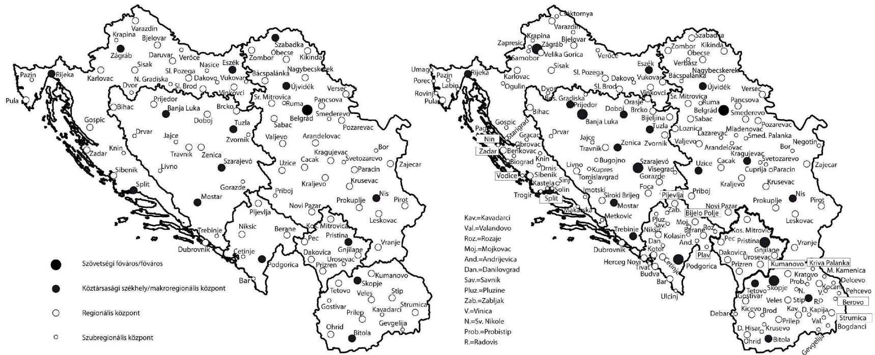
3. ábra: Jugoszlávia és az utódállamok települési hierarchiája 1974-ben és a 2000-es évek elején.