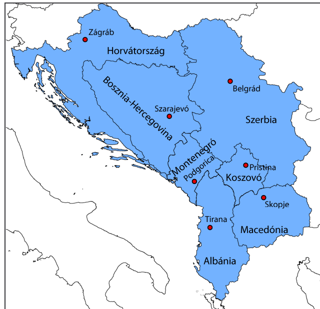
1. ábra: A Nyugat-Balkán országai szerk.: Kovács G.

A Nyugat-Balkán elsősorban politikai kategória és az euroatlanti integráció térségbeli előrehaladtával fokozatosan számíthatunk kiüresedésére, ugyanakkor az 1990-es és 2000-es évek politikai és katonai folyamatai szorosan kapcsolódnak ezen mesterségesen létrehozott politikai kategóriához.