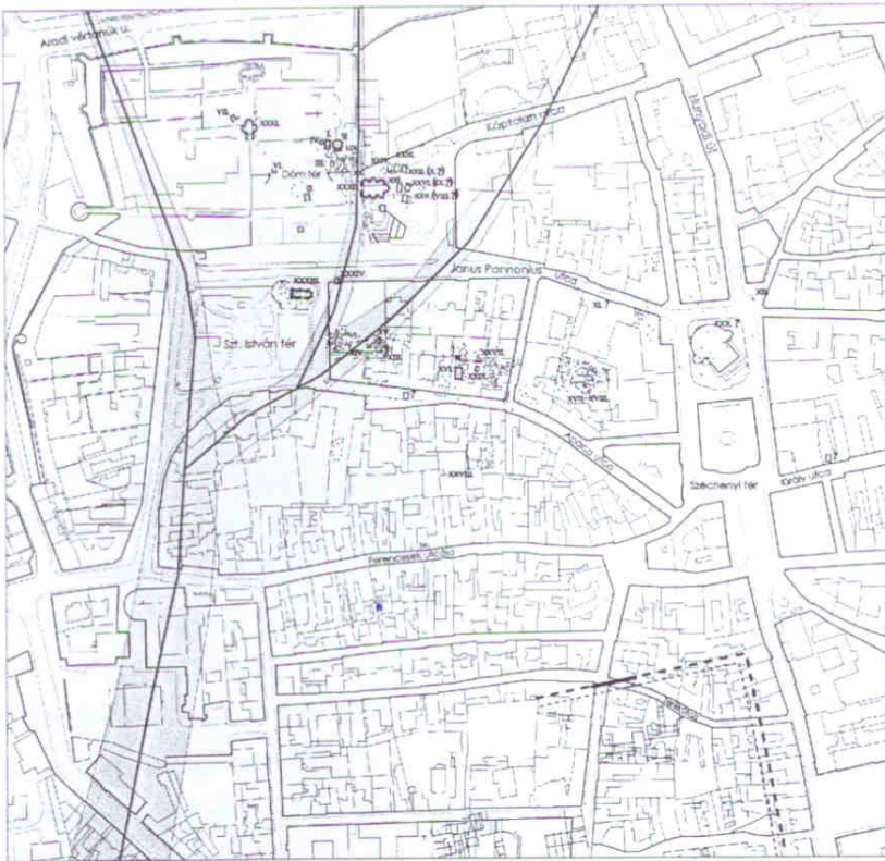
2. kép: Geomorfológiai viszonyok alapján meghatározható utak