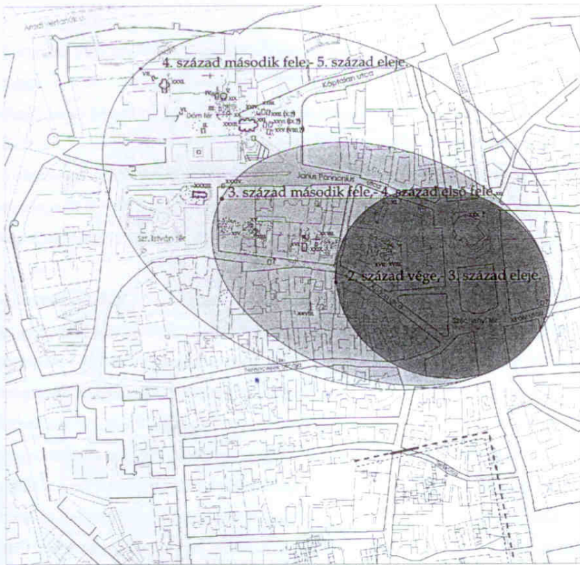
1. kép: Sopianae északi temetőjének belső kronológiája.