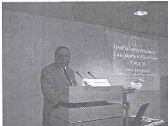
A magyar előadás első pillanatai

Az Élet- és Munka Göttingeni Egyesületen túlmenően a Vincent Verlag közvetlen vendégei voltunk, akik az eljutás feltételeit és az ottani kedvező körülményeket is biztosították számunkra.