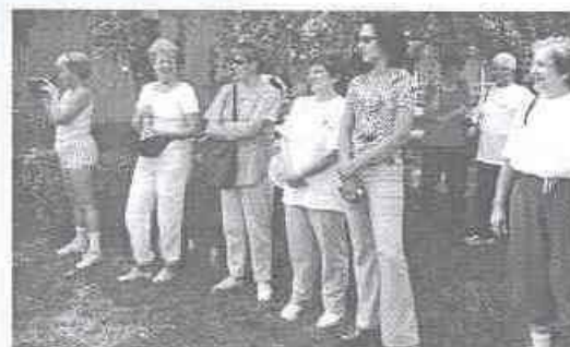
....és akik nézik....