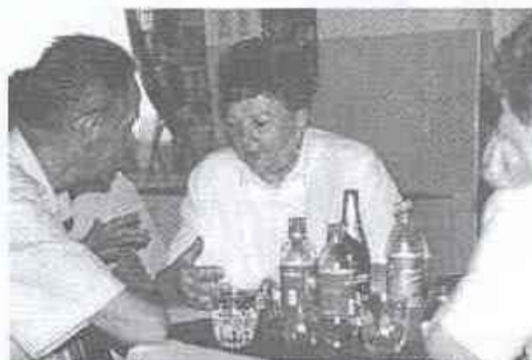
Elmélyült eszmecsere is nyílt lehetőség

Az indulás izgalma lassan visszavett; Hangpróba, érkezés, majd harsány körmenet. Sok ismeretlen ember, meglepett tekintetek – Nem ismeresz, ugye, pedig együtt toljuk a szekeret.