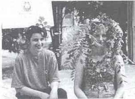
"...díszítsél csinos női fejet..."

Bíró és játékos egyik igazgató, Sipja nincs, de tekintete parancsoló. Ha Colájából kortyint: az a szabadrúgás, Ha részrehajlónak vélik: "kérem, itt ma minden más".