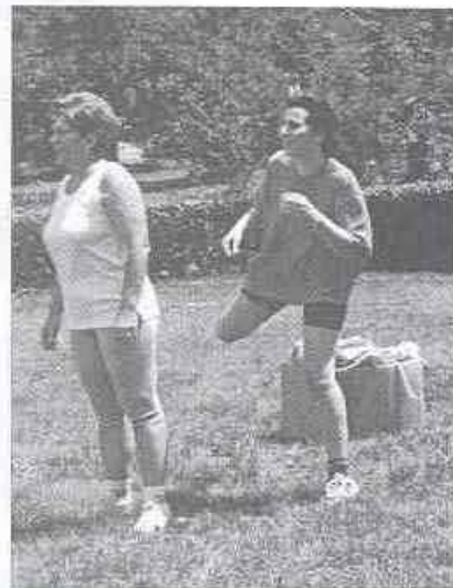
"Együtt rugdalózik a nő és férfi nem..."