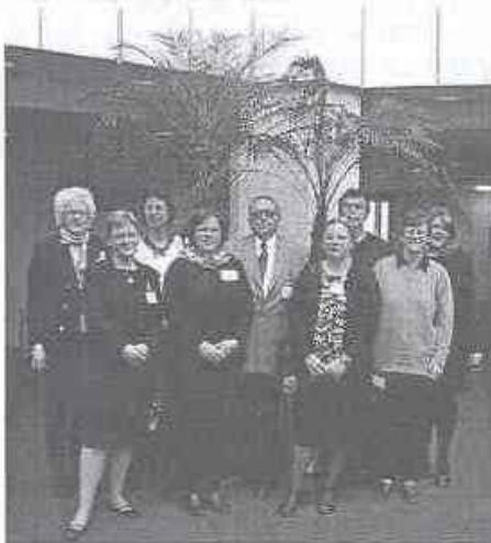
Az angol, holland, finn, német és magyar előadói csoport a nürnbergi Messzezentrumban

Az idősellátás témakörében Németországban Nürnbergben, illetve Hannoverben felváltva minden évben nemzetközi konferencia kerül megszervezésre, ahol az idősellátás egy-egy problémáját tárgyalja meg a kongresszus, és általában ezekhez a kongresszusokhoz kapcsolódnak azok a vásárok (kiállítások), amelyek az idősellátást szolgálják.