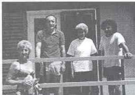
Együtt a Zalaegerszegiek és Kaposváriak