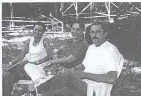
Hárman a pécsi csapatból