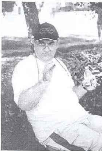
Az igazságos bíró

Nyár, napfény, Balaton, Kari Nap. Langyos víz, júniusi nevetés, játék. Idén, ahogyan tavaly is már, a balatonvilágosi üdülő fogadta be a kar valamennyi vállalkozó oktatóját, dolgozóját. A képzési központok csapatokat alakítottak, a csapatok versenyeztek egymással, a tét igazából mégsem a győztesnek járó kupa volt, hanem a közösséggé válás lehetősége. Kaposvár küzdeni akarása, Pécs vidámsága, Szombathely humora, Zalaegerszeg elsőprő jókedve és a Főigazgatói Hivatal maroknyi csapatának lelkesedése alkotott egy közös egységet.