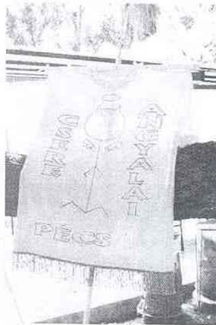
A pécsiek impozáns zászlója. Ez a valóság?