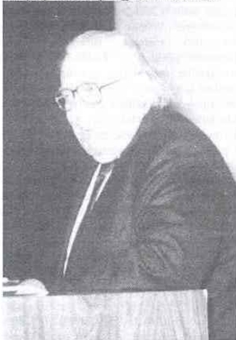
1985-ben Göteborgban és Linköpingben volt tanulmányúton, a POTE-n címzetes

március 1-ig a Sebészeti Osztályt megbízottként vezette. 1970-71-ben az Utrechti Egyetem Szív- és Érsebészeti Klinikáján dolgozott. 1974-ben az orvostudományok kandidátusi fokozatát szerezte meg. 1980-tól a Kaposvári Mezőgazdasági Főiskolán (Kaposvári Egyetem) gastroenterológiai állatkísérletes vizsgálatokat végzett, 1981-ben a Kaposvári Kórház I. sz. Sebészeti Osztály vezető főorvosává és megyei szakfőorvoská neveztek ki, valamint a Magyar Sebész Társaság vezetőségi tagjává választották.