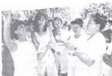
Csapatmunka zalaegerszegi módra