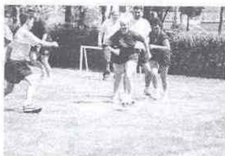
Önfeledt, vérre menő focizás: foci első vég

Nem kétséges, hogy a Kari Nap sajátos hagyománya a főiskolának, mint ahogyan az sem kétséges, hogy mindebből nemcsak a kar nyer, hanem a képzési központok és a kollégák is valamennyien. Kicsit más ez a nap, kicsit más arcunkat mutatjuk meg.