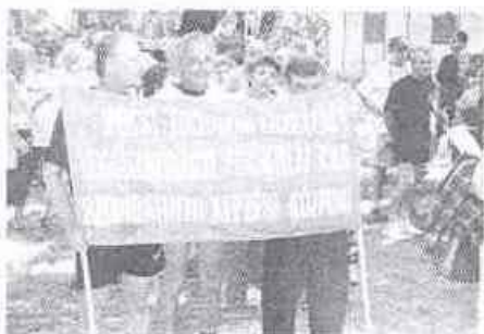
Érkezik a szombathelyi csapat