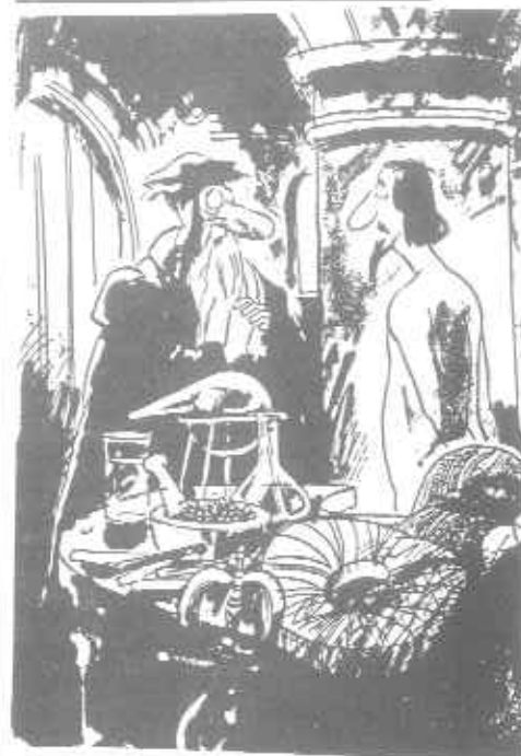
Nos, Sir Walter, attól tartok az Újvilágból nemcsak krumpplit és dohányt hozott magával.