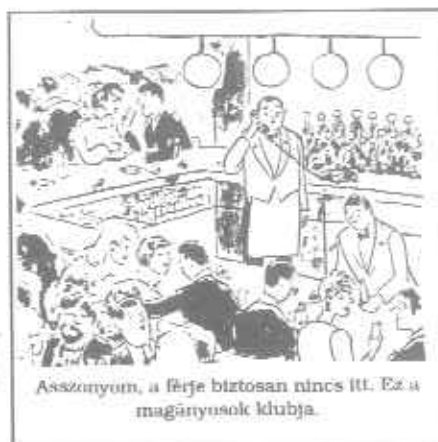
Asszonyom, a férje biztosan nincs itt. Ez a magányosok klubja.