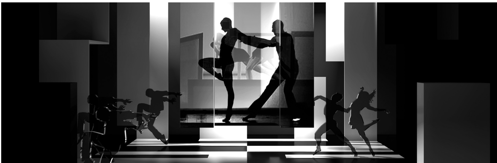
Kollázs: Sebestény Ferenc (2011). A Pécsi Balett Liszt előadásának színpadterve. Számítógépes virtuális tér, render, fotómontázs.