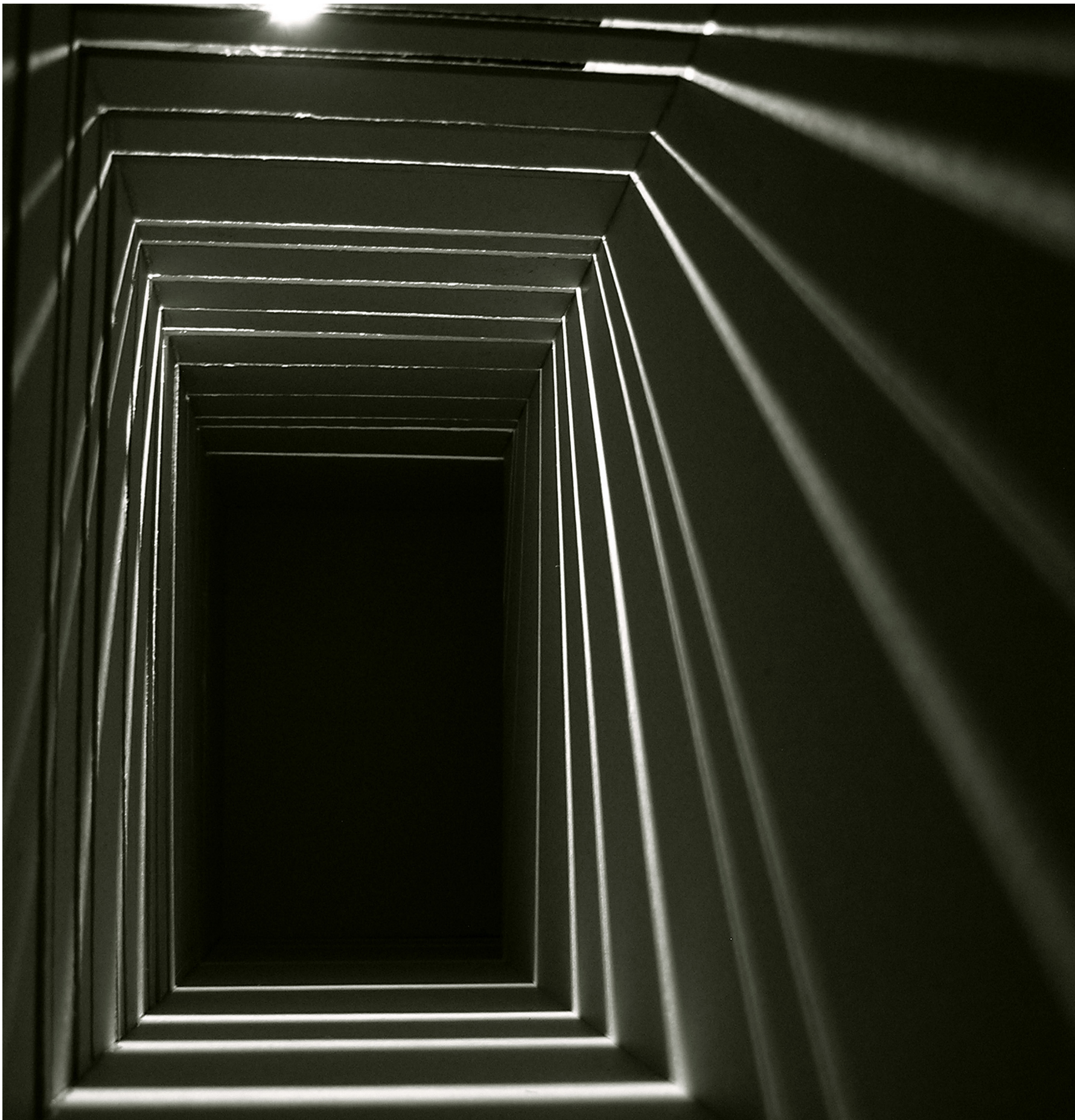
Sebestény Ferenc: Kollázs . Cserna László: Apokrif című filmjének tere (Tér és Mozgás kurzus, 2007.) és egy táncmozdulat a Haláltánc-variációk című előadásból (fotó: Dusa Gábor 2011).