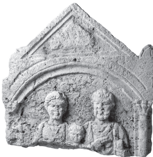
1. kép: A szőnyi sírkőtöredék Rómer Flóris jegyzetfüzetében (1859) és fotón (2006)