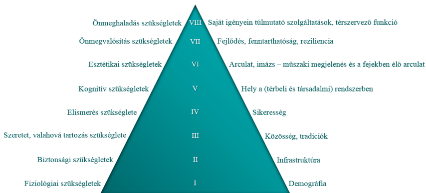
2. ábra A települési működés motivációs modellje A. Maslow szükséglethierarchiájával összevetésben (Karsai V. & Trócsányi A., 2020)

A lehatárolás után 348 település (222 városi jogállású, illetve 146 község vagy nagyközség) számára – a koronavírus-járvány korlátozásai miatt online (2021 tavaszán) – került kiküldésre egy 73 kérdésből álló, nyolc tematikát lefedő kérdéssor, amellyel a korábban említett kérdéseinkre igyekeztünk választ kapni. A kérdéssor a következő modell alapján épült fel (2. ábra).