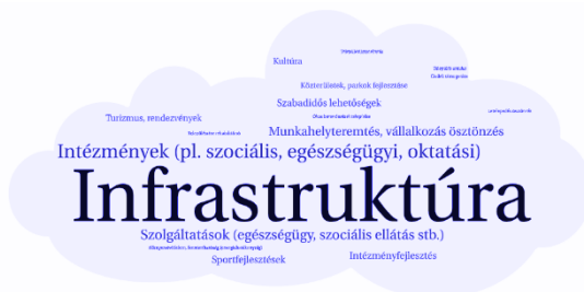
4-5. ábra Szabadon rendelkezésre álló forrás esetén célzott fejlesztendő tematikák (a kérdőív 65. kérdésére adott válaszok alapján) – községek és nagyközségek (zöld ábra), illetve városok (kék ábra), 2021 (szerk. Karsai V.)