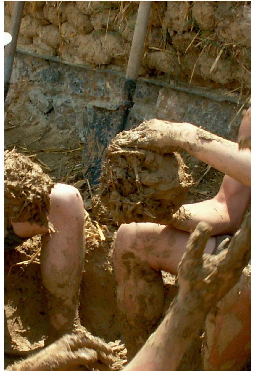
01. földház - 2007 Gyűrűfű

A felmérő és építőtáborokban való munka elvégzése, az eredmények felmutatása alapja az együttműködés, csoportmunkára való képesség, melynek elsajátítása szintén egy fontos tanulási folyamat a „feladat ürügyén”.