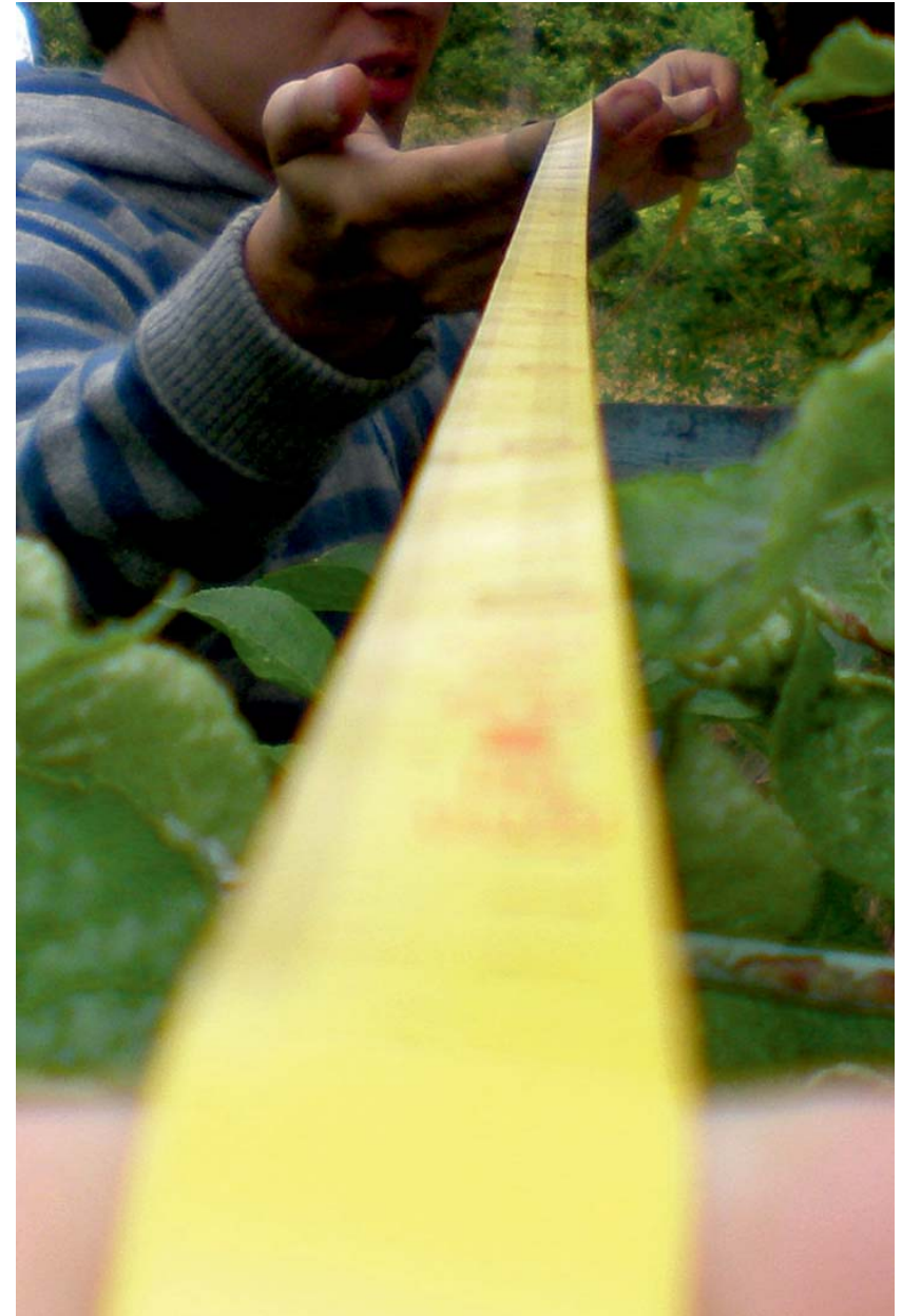
05. felmérés - 2007 Borsodgeszt

Építész-szakmai világtrend is, hogy nem a végső objektum annyira az érdekes, hanem a létrehozásuk története.