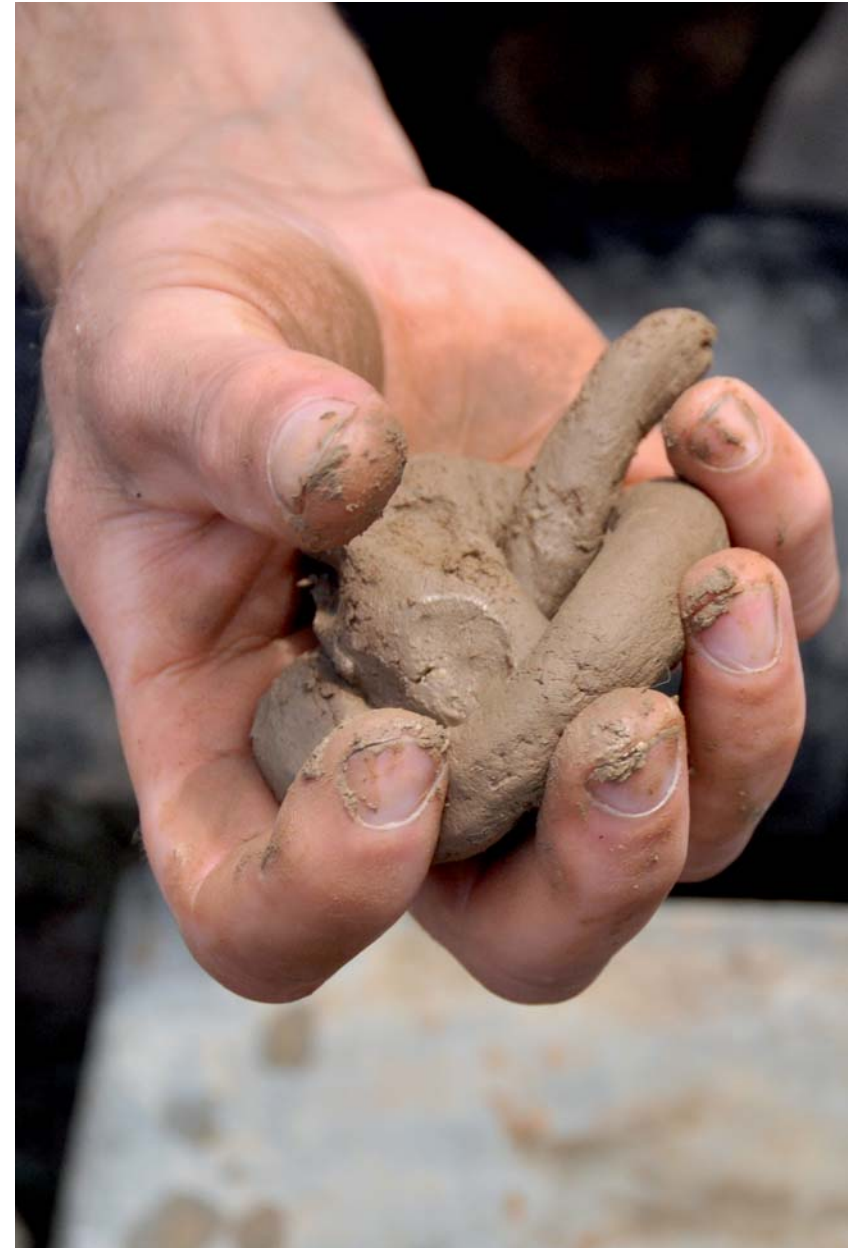
03. kemence - 2010 Borsodgeszt

A felmérések és az építések sokszor időben később megismételhetetlen forrásokká, alapanyagokká válhatnak.