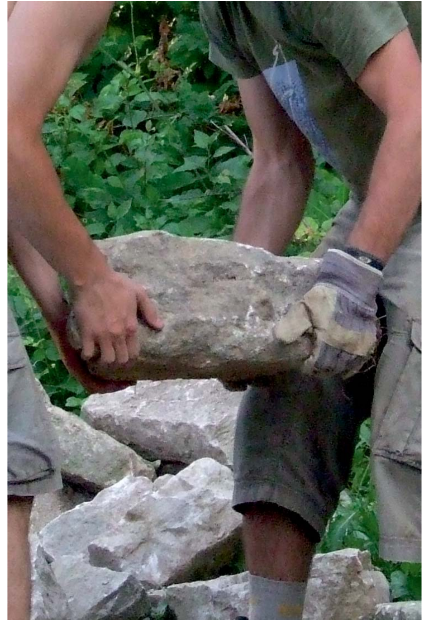
06. sertésól - 2014 Sztána

Egy-egy megvalósított objektum a helybéliekben és a létrehozókban is közösséggé formálódást alakít(hat) ki.