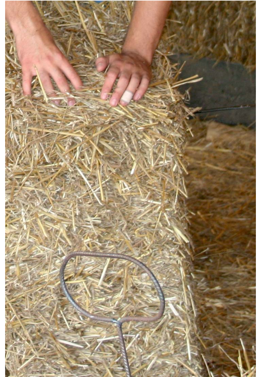
04. szalmabálaház - 2008 Nemesrádó

A kortárs építészet ne formailag utánozzon, hanem munkamódszerekben, elvekben!