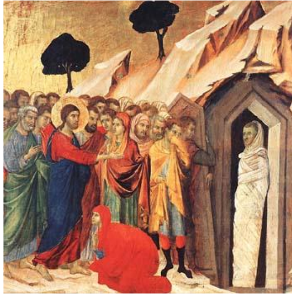
Lázár feltámasztása 167

A Lázár-nap kalendáriumi helye maga is jelkép. A bélpoklos általában a telet jelképezte. Bibliai példák is tanúsítják, hogy a bélpoklosságnak nevezett lepra betegségek egyik tünete a bőr hámlása és kifehéredése. A bethániai Lázár feltámasztása még egyértelműbb jelkép, hiszen a téli napforduló valójában a természet újjászületésének, feltámadásának a kezdete.