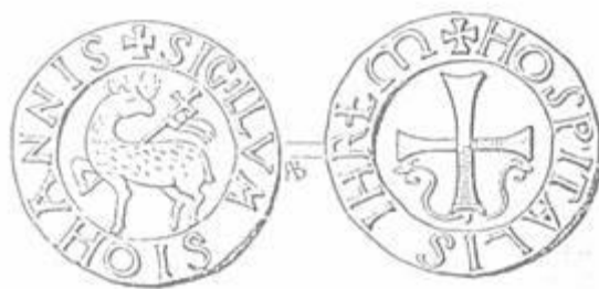
A johanniták pecsétje 294

Hunyadi Zsolt álláspontja szerint ezt sem a történeti tények, sem a filológia nem támasztja alá, illetve maga, a vizsgált oklevél-részlet, sem utal ilyen lehetőségre. 295