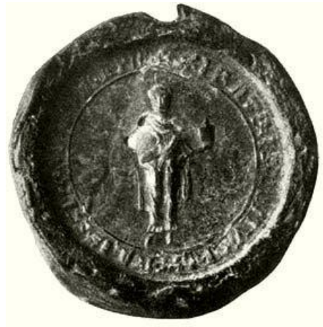
Ispotályos lovag gyógyszeres edénnyel a XIII. században, a budafelhévízi rendház pecsétjén 385

budafelhévízi házaik - által kiállított oklevél intitulációinak és inscripcióinak – címzésének - elemzése kapcsán bizonyítja a rend szerepét és helyét a korabeli oklevélkiadás terén. 384