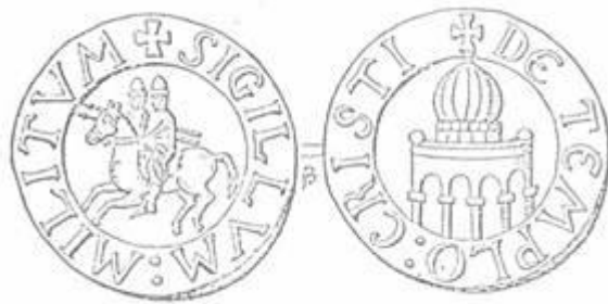
A templomosok pecsétje 226

Eleinte „szegény lovagoknak” ( pauperes commilitiones Christi ) nevezték a rend tagjait, mivel eleinte sem egyenruhájuk, sem elegendő lovuk nem volt. Pecsétjükön is az látható, amint - ahogyan arról a korabeli források tudósítanak - két lovag kényszerült egy ló hátára ülni.