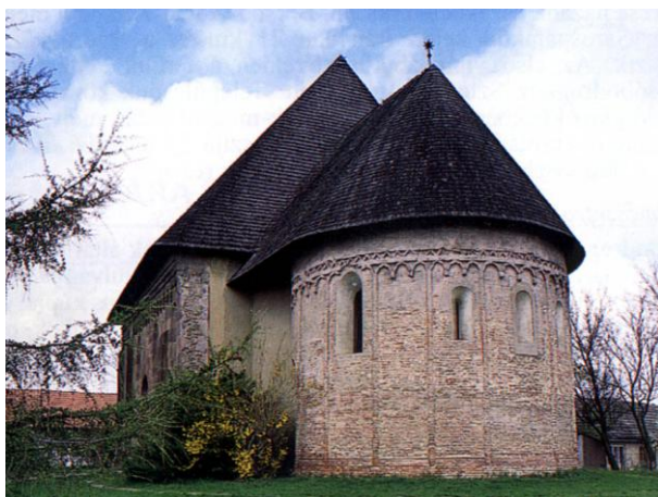
A karcsai egykor stefanita, ma református templom D-K-i homlokzata 376

A renchez tartozott Torda is és a Cruciferiről kapta a nevét Torda mellett a Keresztes-mező. A rend feladata volt hosszú időn át az al-dunai flotta működtetése és a déli határ dunai felvigyázása. 377