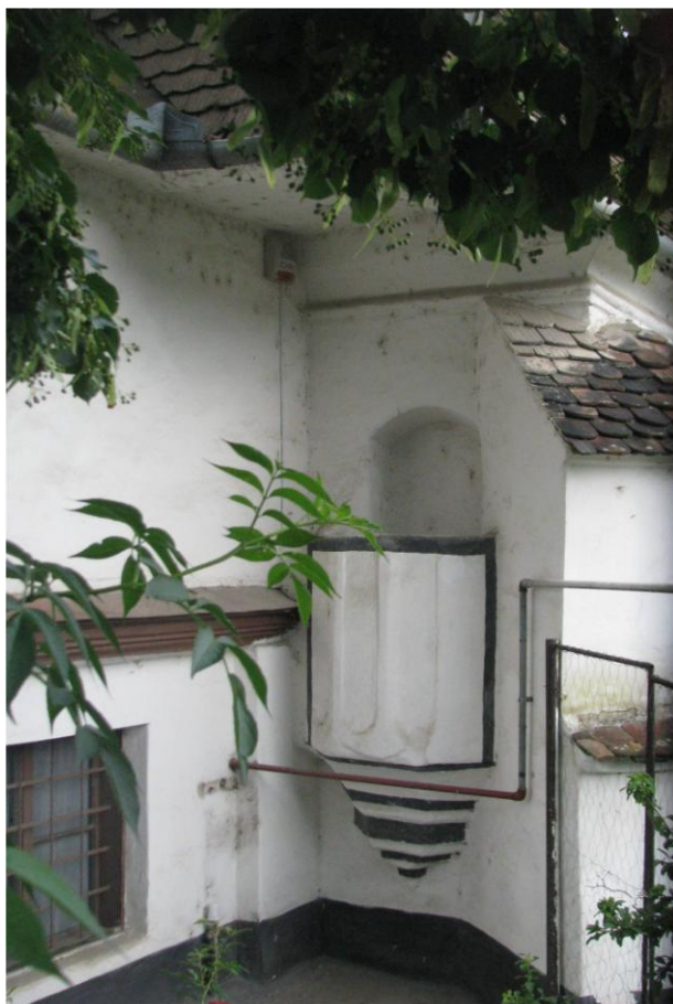
A segesvári lepra-szószék (a szerző felvétele, 2013. július)

partján épült egy puszta részen, amelynek „Gringraas” volt a neve. A kórház tulajdonképpen pár kunyhóból állott - mint azt Faber is leírja fent már idézett költeményében - melyek közül egy még a XIX. század elején is fennállt. A kórház közelében építettek egy kis templomot is, külső oldalán szószékkal, mivel a néha 20-30 évig is sínylődő leprásoknak szükségük volt lelki vigasztalásra, azonban a templomba bemenni nem volt joguk. A templom környéke ma már be van építve, lakóházak veszik körül ezt a szomorú emléket. A templom hátsó oldalától pár méterre gazos vasúti sín fut. Ezen a helyen állt a hajdani kórházépület. A lepra-szószéket - amelyet 1684 óta már nem használtak - a kíváncsi szemek előtt a szomszédos veteményeskertben futó tök levelei takarják el. A kezdetben katolikus, majd a XIX. századtól lutheránus magyar templomot a segesvári román görög katolikus egyház már évtizedekkel ezelőtt átvette. Bár Segesvár város turisztikai honlapján 209 szerepel a műemlék, nem járnak erre turisták.