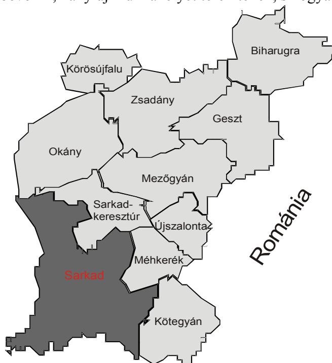
1. ábra. Sarkadi kistérség települései

Sarkad, Békés megye észak-keleti részén fekszik. Mezőgazdasági, állattenyésztési és élelmiszer-feldolgozási hagyományokkal rendelkező város. A kistérség fejlesztési integrációjának háttérét a Dél-alföldi Euró-régió által nyújtott intézményes lehetőségek, fejlesztési irányok és növekvő fejlesztési források is biztosítják. A Kistérségi Fejlesztő Egyesület (amelynek tagja a sarkadi kistérség is) közvetlen romániai határkapcsolatokkal rendelkezik, (Bihar megye) így a romániai alapanyag piac (mezőgazdasági termeltetés) felé a nyitás megtörtént (1. ábra). Sarkadon egy konkrét energiatermelő beruházás megvalósulása megmutatja, milyen megújuló energiaforrást kívánnak a fejlesztésbe bevonni, hány új munkahelyet teremtenek, s hogyan áll a program jelenleg.