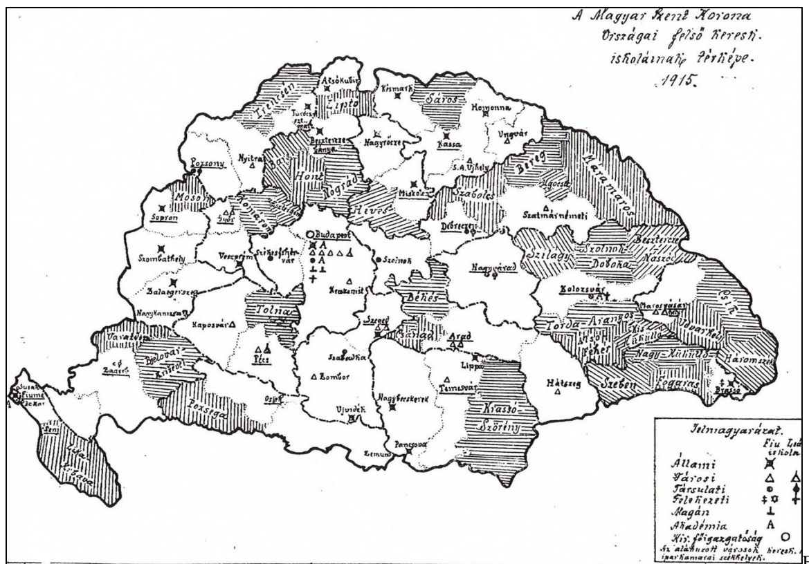
1. ábra. A felső kereskedelmi iskolák eloszlása Magyarországon 1915-ben