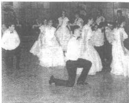
báli versbe szedve